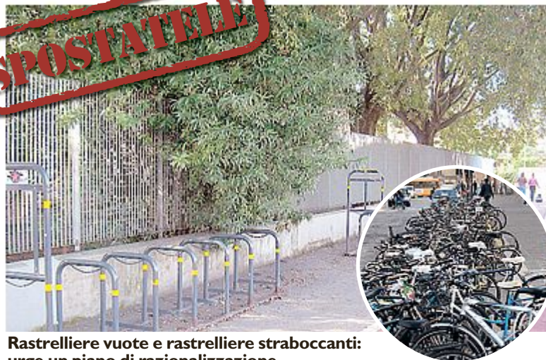
Rastrelliere vuote e rastrelliere straboccanti: urge un piano di razionalizzazione

Oppure: ma perchè la pista ciclabile di Firenze sud finisce davanti alla porta di un bar di via Erbo-sa? Perchè in viale Redi la pista finisce al ponte di San Donato e non prosegue di 50 metri fino alla Coop o al nuovo quartiere di Novoli? Facciamo ordine e scegliamo